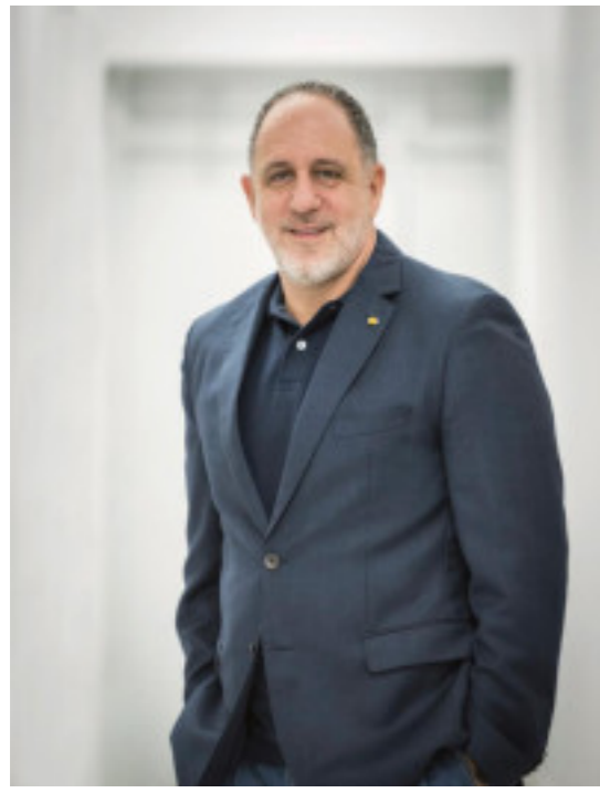
Président Membre élu en 2014

Rôle : bureau de gestion des questions financières, RH, recrutements (contrats locaux), achats et travaux en collaboration avec la direction de l'établissement. N'intervient pas sur la partie pédagogique.