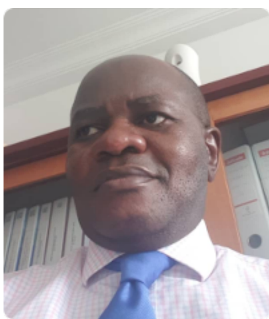
Trésorier Membre élu en 2020

Membre des commissions : Recrutement du personnel en Contrat Local, RH, Comité de crise , Révision des Statuts et Règlement Intérieur Suppléante des commissions Bourses et Finances