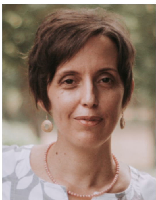
Vice Présidente Membre élue en 2020

Membre des commissions des Bourses, Hygiène, Sécurité & Conditions de travail des personnels, Achats/Informatique/Bureautique, Conseil d'Etablissement, Recouvrement Suppléant des commissions Finances, Communication et Comité de crise