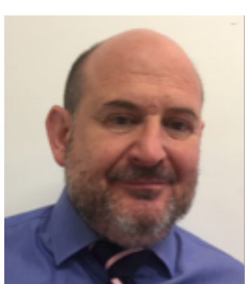
Trésorier adjoint Membre élu en 2014

Membre des commissions Hygiène, Sécurité et Conditions de Travail des personnels, Finances et Recouvrement Suppléant de la commission révision des statuts et du règlement intérieur